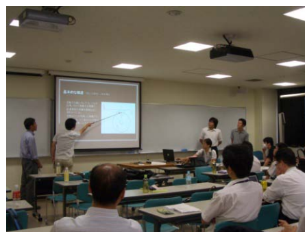
先端研究装置開発プロジェクトの様子

マシニングセンタによる3D-CADモデルを元にした実際の加工とパス効率評価、最新鋭のターニングセンタと多軸複合対応CAMソフトの連携による複雑形状のワンチャック加工、およびWEDMIによる加工を体験する。さらに、CAD/CAE実習で設計した形状物をRPで製作し、RPの位置づけ、実際の効果などについて考察する。